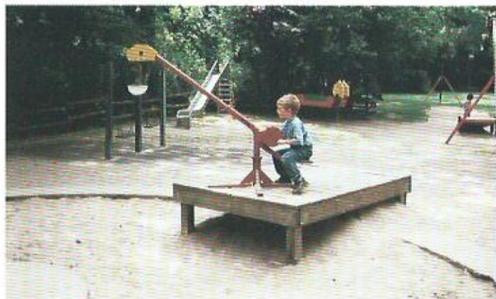
Der richtige Spielplatz für Baggerführer

Verlängerungstipp 2: siehe Aukamm-Naturerlebnistal